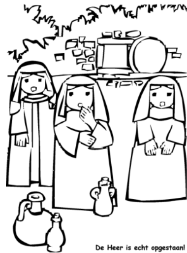
De Heer is echt opgestaan!